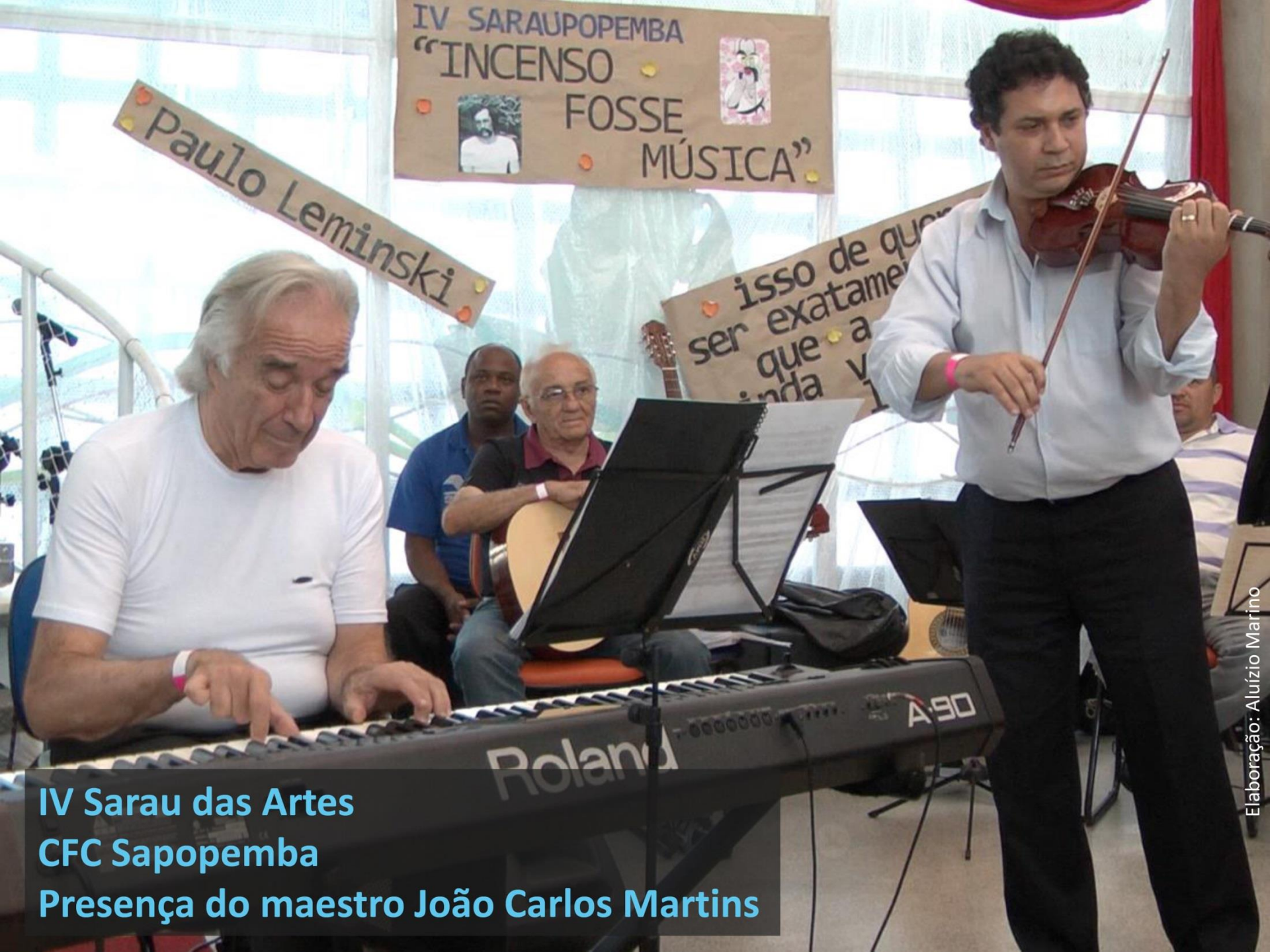
IV Sarau das Artes CFC Sapopemba Presença do maestro João Carlos Martins